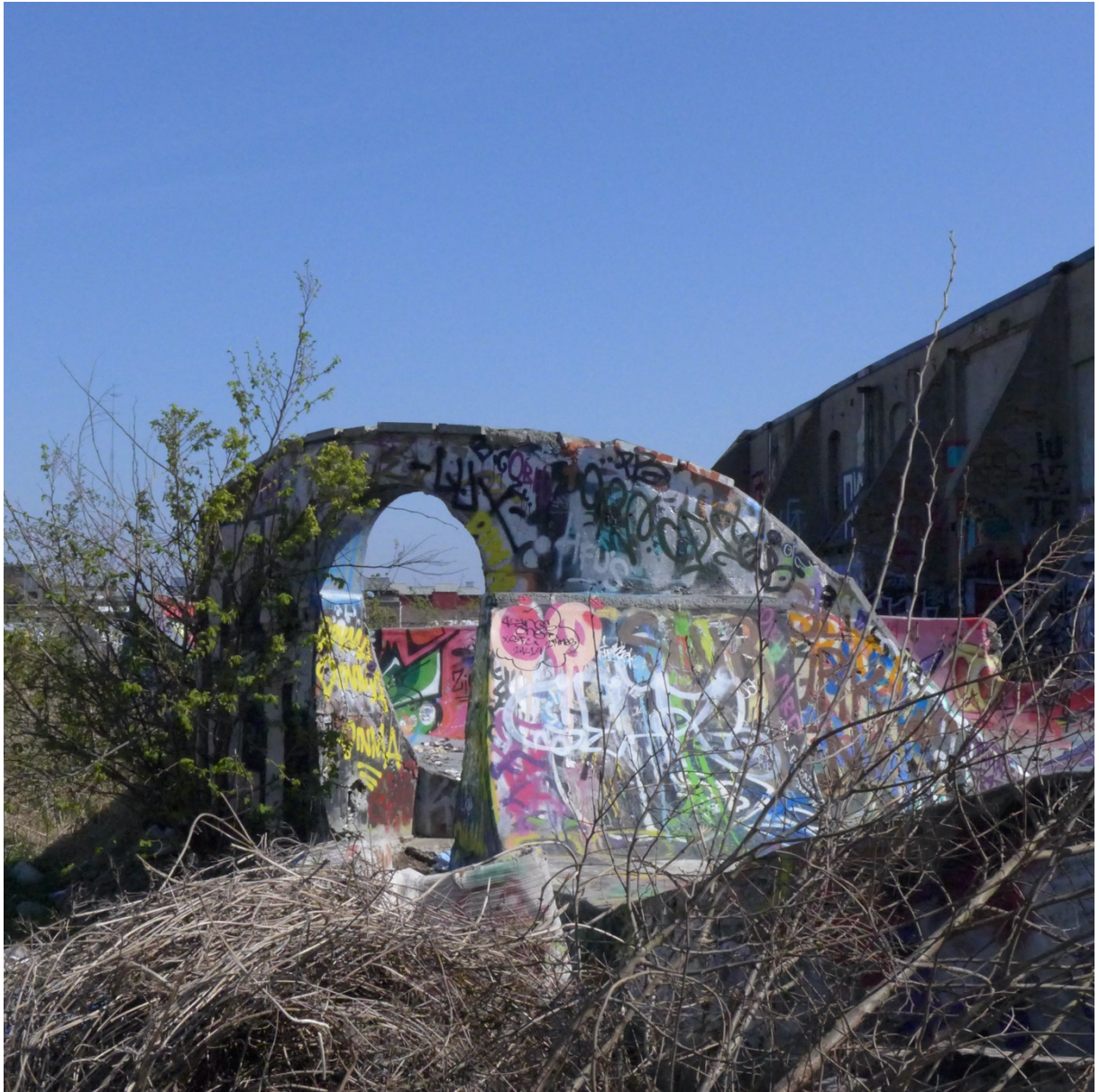
Kvarteret "Brännaren" Malmö