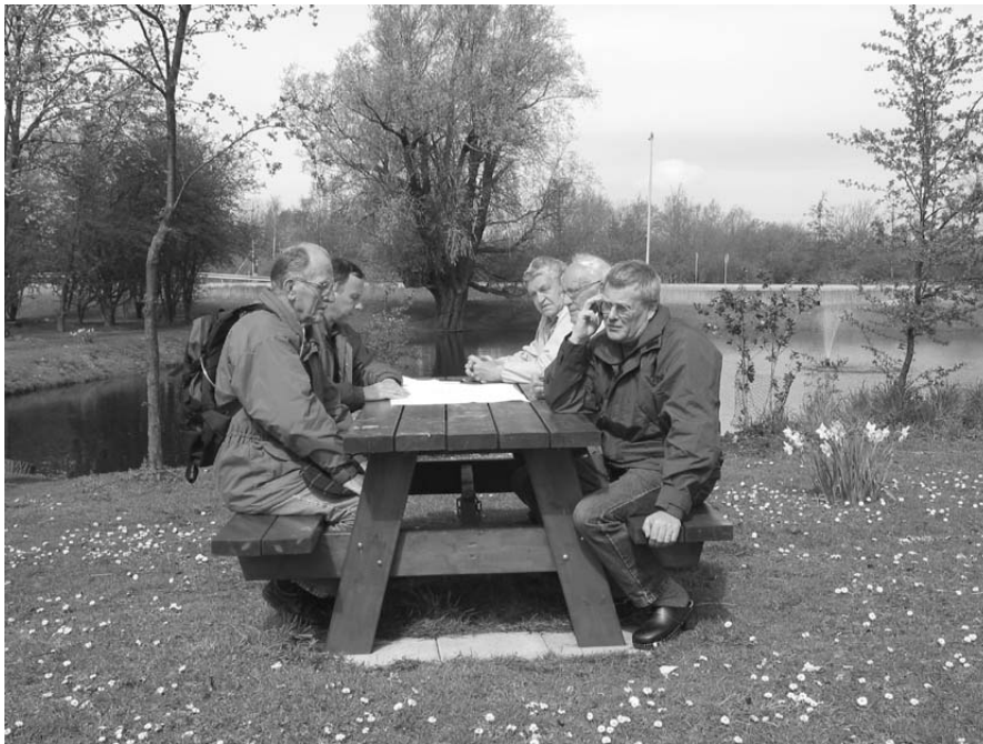
Figur 9. Möte mellan parkansvarig och brukare i parken.

I inledningsskedet av fallstudien gjordes intervjuer med enskilda medlemmar av föreningen. Därefter gjordes vid ett par tillfällen intervjuer med flera ur föreningen samtidigt ute i parken. Vid varje tillfälle valde föreningen att bjuda in den ansvariga parktjänstemannen på kommunen. Mitt intryck från dessa möten var dels att det råde samstämmighet mellan föreningen och parktjänstemannen, dels att man från föreningens sida ville markera att det inte fanns några konflikter mellan kommunen och föreningen.