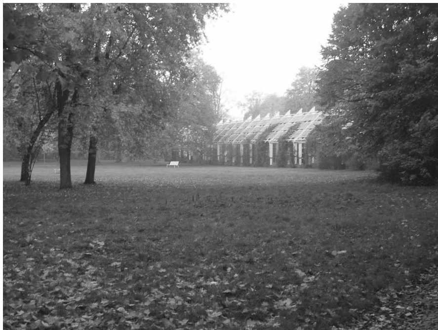
Figur 10. Folkparken i Lund.

Parken anlades av arbetarrörelsen i slutet av 1800-talet. Under första halvan av 1900-talet anordnades teater och musikunderhållning i parken. I slutet på femtiotalet, efter drygt sextio års verksamhet, gick parken i konkurs. Marken såldes till ett bostadsföretag, men köptes senare av staden (Karlsson, 1995). Vid tiden för fallstudien förvaltas parken av den kommunala parkförvaltningen. Parken fungerade som en offentlig park. En del av parken betecknades i stadsplanen som Allmän plats/PARK. Den andra delen betecknades som Specialområde för folkparksändamål.