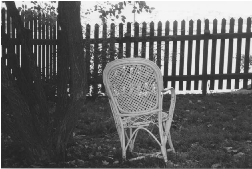
Figur 13. Vy i trädgården Kattfot och blå viol.

[D]en ska få va lite vildvuxen - att ha lite det här ursprungsutseendet som du ser här på bilderna här från sekelskiftet. Och den ska absolut inte vara tuktad på något sätt. Jag menar, det är ju inte nån barockträdgård, utan det här är en sekelskiftsträdgård.