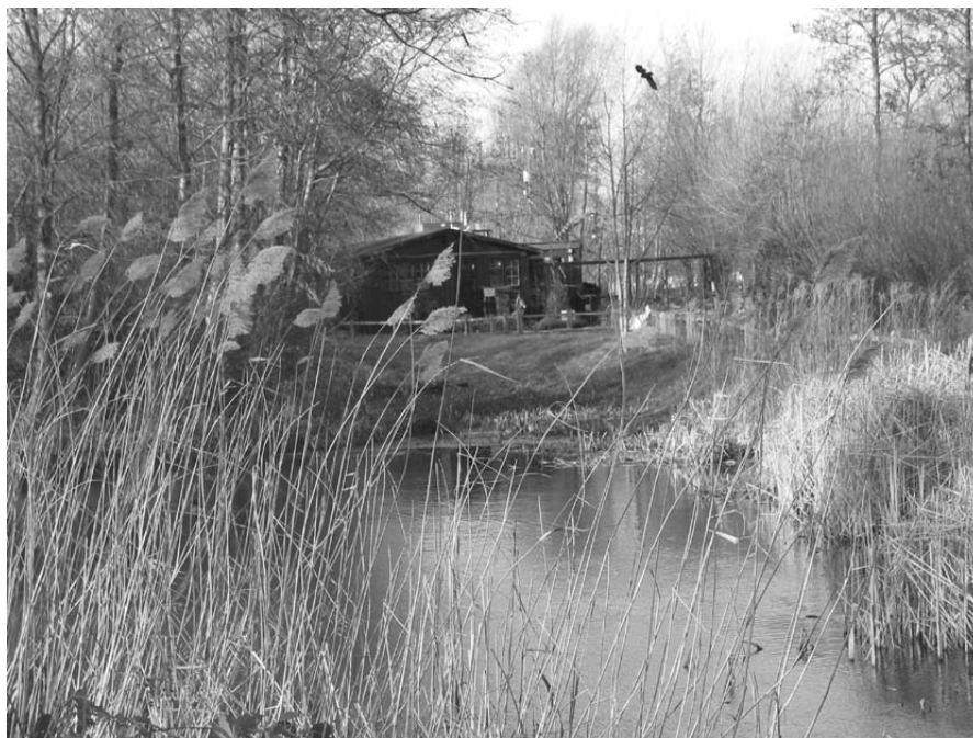
Figur 1. Camley Street Natural Park, London.

Community gardens kan betraktas som ett samlingsnamn för flera olika typer av platser. Här finns platser som med svenska perspektiv ser ut som konventionell parkmark - träd, buskar, gräsmattor och perenner. Här finns också urbana natur- eller ekologiparker. Slutligen finns platser som huvudsakligen används för odling, vilket tycks vara den vanligaste typen. I utländsk litteratur har de svenska koloniträdgårdarna jämförts med community gardens (Francis et al. 1984). Gemensamt för dessa olika typer av ytor - community gardens - är att de till största delen sköts och förvaltas av brukare. En community garden är alltså sällan en park i en svensk bemärkelse av ordet, men den har flera av de funktioner som ofta tillskrivs parker: den fungerar som mötesplats för grannskapet och erbjuder en möjlighet till rekreation.