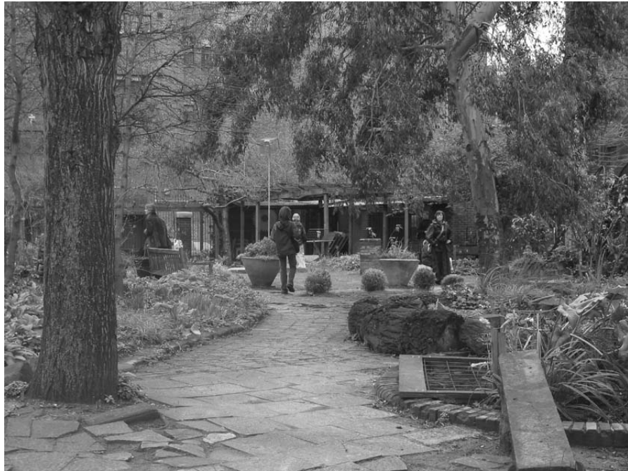
Figur 2. Phoenix Community Garden, London

Det finns alltså några viktiga skillnader mellan ett engagemang i en community garden och att medverka i svensk kommunal parkverksamhet. Att delta i arbetet med en community garden kan i många fall vara ett sätt att närma sig en parkstandard som vi i Sverige tar för självklar. Att delta i arbetet kan också vara ett sätt att förhindra en exploatering av en friyta i grannskapet. I Sverige är friytan i de flesta fall skyddad av detaljplan och av att kommunen står som ägare till marken.