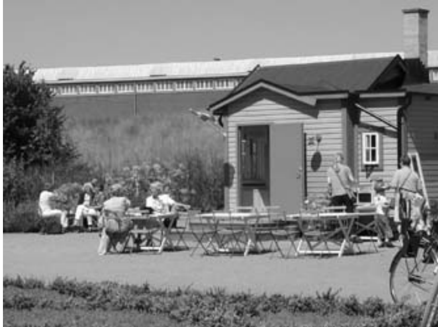
Figur 6. Kaféet i Slottsträdgården, Malmö.

vardags med arbetsuppgifter med stora likheter med de arbetsuppgifter de utförde ideellt för Slottsträdgården. Flera var anställda inom den offentliga sektorn eller arbetade i offentligt finansierade organisationer.