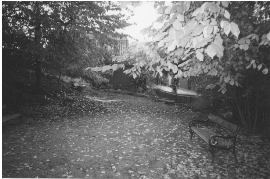
Figur 12. Solrosparken.

Solrosparken på Södermalm låg på en tomt som hade avsatts för ett parkeringshus. Parkeringshuset blev aldrig byggt. Istället byggdes ett daghem på en del av tomten, medan en annan del i stadsplanen lades ut som parkmark. Parken var ett par hundra kvadratmeter stor.