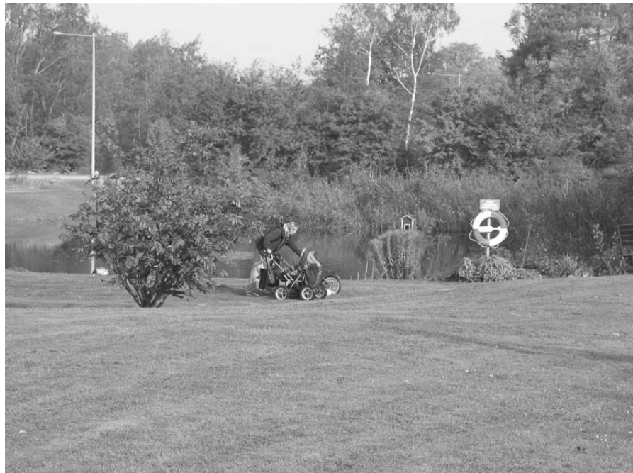
Figur 8. Besökare i Slättängsparken.