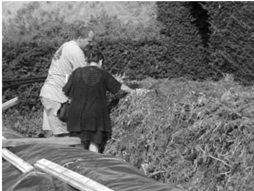
Figur 7. Trädgårdsmästaren visar komposten för en besökare.

I en större grupp varierade graden av engagemang mycket, från att ställa upp vid olika arrangemang till att gå på vänföreningens årsmöte. 10-20 personer ställde ofta upp på olika arrangemang. Årsmötena besöktes av ungefär femtio personer. En stor grupp deltog i någon mening formellt genom att de var medlemmar i vänföreningen. Genom medlemskapet gav de ett ekonomiskt bidrag och ett stöd till verksamheten. 1999 hade föreningen ungefär 600 medlemmar. Av dessa var det, enligt föreningens kassör, ungefär 100 som hade varit medlemmar flera år i rad.