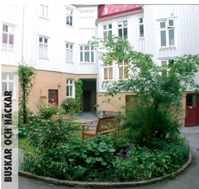
BUSKAR OCH HÄCKAR

Inga grenar som utgör ett hinder hänger ut över entréer eller vägar.